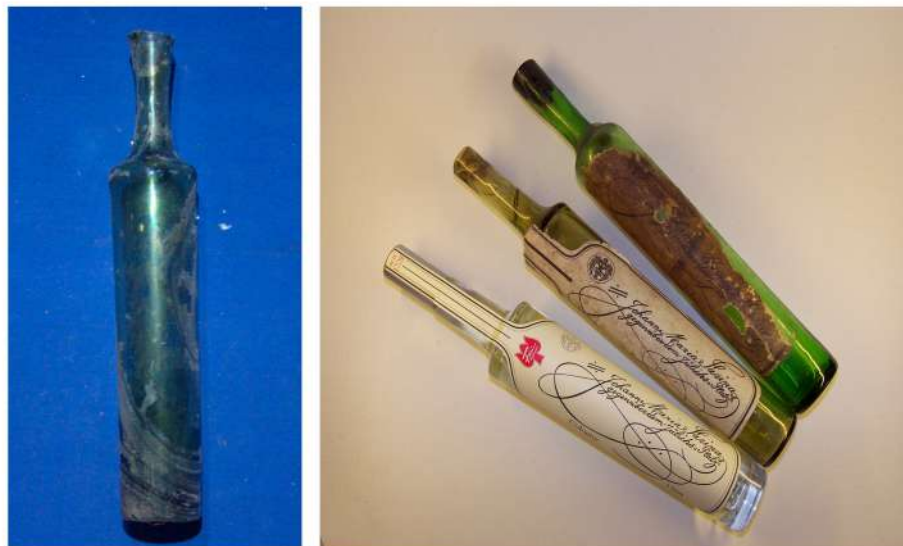
Fig. 9. A la izquierda, una de las varias botellas de “Original Eau de Cologne, 1709” halladas en el sitio (Foto R. Giambelluca, 2018). Se trata de la marca registrada de perfume más antigua del mundo y uno de los productos de belleza más caros del siglo XVIII; se dice que era el favorito de Napoleón Bonaparte. A la derecha, tres ejemplares de colección del producto que conservan la etiqueta original de papel. Tomado de https://www.farina1709.com . Consultado mayo 2019.

da» aparecieron recurrentemente entre los objetos descartados en el sitio. Aunque comercializado como colonia, el popular producto se proclamaba como una sustancia poseedora de propiedades milagrosas, cuyo uso prolongado era capaz de prevenir infecciones y clamar dolores (Fig. 10). Poderoso limpiador espiritual de hogares y negocios, servía tam-