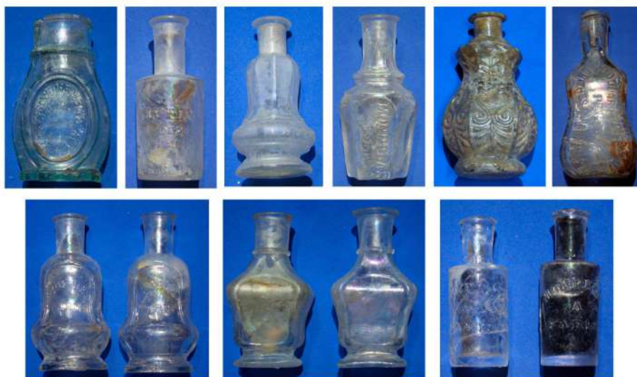
Fig. 8. Algunos ejemplares de la variedad de botellas de perfumes franceses recuperados en los distintos pozos de basura excavados en el sitio. Las piezas corresponden a productos fabricados y comercializados durante todo el siglo XIX y hasta las primeras décadas del XX.

Pero las pequeñas botellitas de vidrio contenían mucho más que cosméticos; lociones tales como el « Agua de Flori-