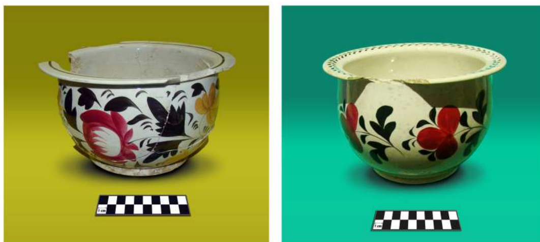
Fig. 6. Bacinillas de origen inglés pintadas a mano con detalles de estampado de sellos. La decoración floral tipo « Gaudy Dutch » se caracteriza por presentar grandes flores de colores fuertes, vivos y brillantes, con mucho uso del rojo, negro marrón y amarillo.