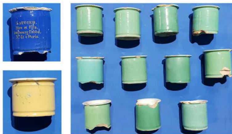
Fig. 11. Una muestra de gran cantidad de potes de ungüento procedentes de diversos países de Europa, fueron hallados en sitio durante la excavación; se trata de piezas cerámicas muy pesadas para su pequeño tamaño (la mayoría de 5 cm de diámetro), con una base muy gruesa que hacía que el contenido de cada envase fuera escaso.

proporcionan una primera mirada a la representación material de las prácticas de aseo personal e higiene hogareña de las familias acomodadas de Buenos Aires en el siglo XIX y ofrecen un muestrario de los principales productos relacionados con el cuidado cosmético y estética personal. En conjunto, los restos arqueológicos recuperados en el sitio constituyen uno de los hallazgos más abundantes, diversos y mejor conservados de la arqueología histórica de la ciudad de Buenos Aires. La