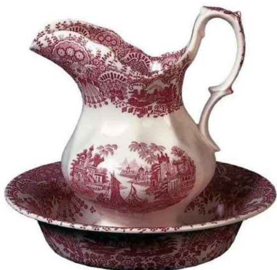
Fig. 4. Palangana y jarra, loza fina blanca con impresión por transferencia, siglo XIX. De la marca La Cartuja de Sevilla-Pickman S.A. Colección particular.