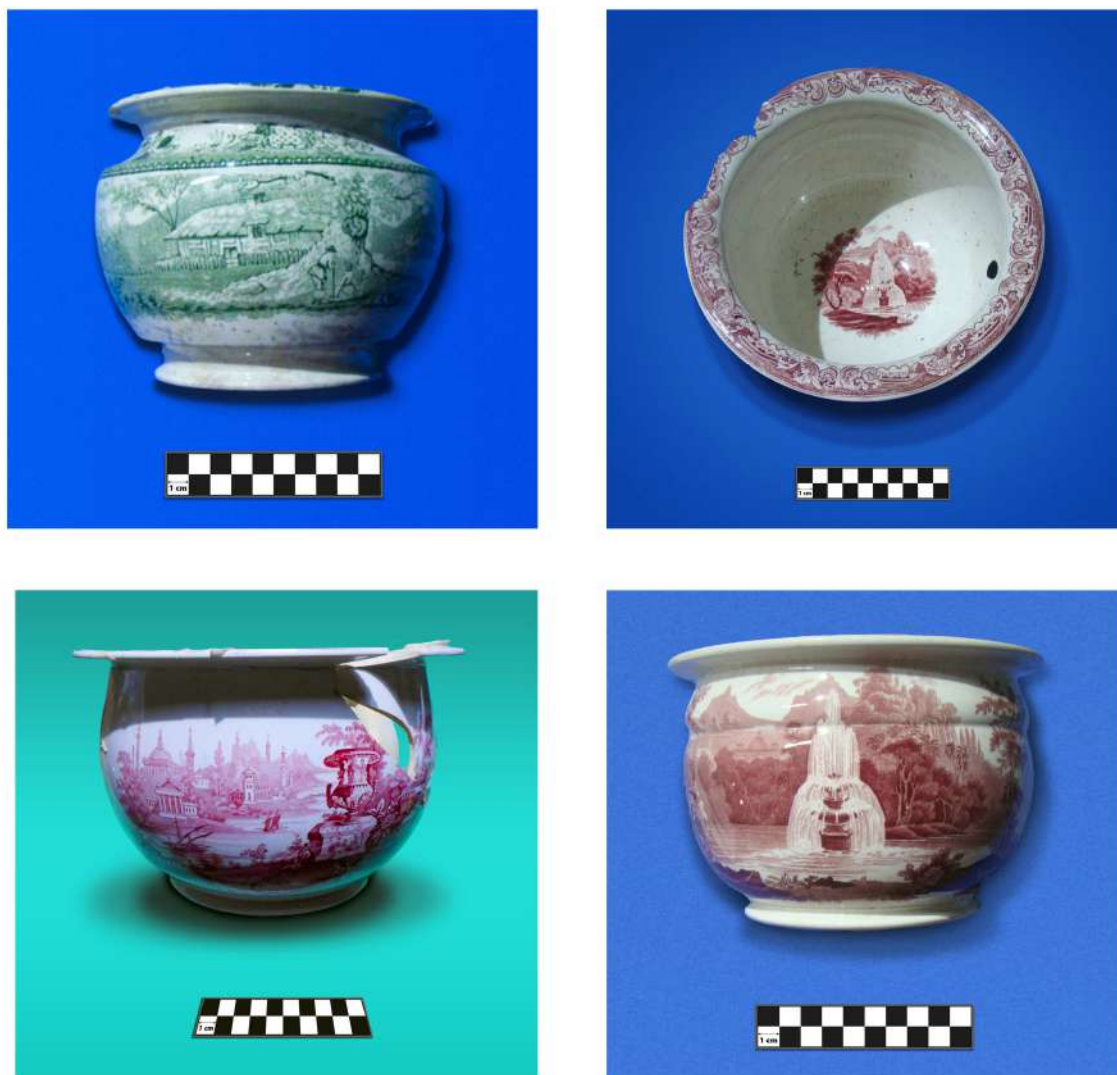
Fig. 7. Bacinillas de origen inglés con diseño impreso. Esta tipo de loza fue la más común de su época, conocida y fabricada en todo el mundo; presentan motivos estampados que pueden cubrir toda su superficie, lo que se logra mediante la transferencia de un grabado. Los motivos básicos son los chinescos y los conmemorativos, aunque no faltan los anecdóticos, históricos y bucólicos.