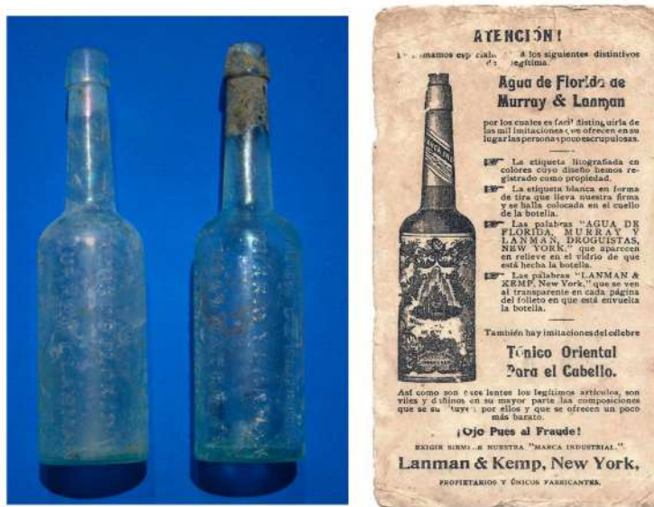
Fig. 10. Botellas de “Agua Florida” recuperadas en una de las letrinas excavadas. El nombre hace alusión a la base floral de la fragancia pero también a la Fuente de Juventud que, según la leyenda, se localizaba en la península de Florida, en América del Norte. Una publicidad argentina de “ Agua Florida ” de fines del siglo XIX en la que el fabricante alerta sobre las falsificaciones e imitaciones que circulaban en la época, lo que da cuenta de la enorme popularidad del producto.