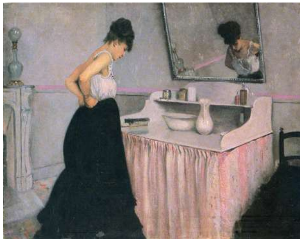
Fig. 3. La escena de una mujer francesa acicalándose muestra un ensamble de objetos muy semejante al que utilizaban los porteños de la época. Mujer en el tocador , Gustave Caillebotte, Francia, circa 1873. Reproducción en colección Particular.

Hasta mediados del siglo XIX el lavado personal de la mayor parte de los porteños estuvo reservado a aquellas partes del cuerpo hasta donde llegaba la mirada de los demás. En un aseo gobernado por las apariencias, la forma más corriente de limpieza entre las personas acomodadas consistía en enjuagues parciales realizados con jarras y palanganas de loza o porcelana que se usaban en un lavatorio o tocador dentro del dormitorio (Figs. 3 y 4). Un conjunto semejante de enseres, también llamados aguamaniles, eran utilizados en la mesa, dónde los comensales podían lavar sus manos y boca antes de comer, pero en ese caso las piezas eran de menor tamaño e incluían una jarrita acompañada de un plato hondo (Fig. 5). Con frecuencia, esas piezas se adquirían como parte de un juego de vajilla sanitaria que incluía también bacinillas –más conocidas como pelepas o urinales- y cuyos diseños, curiosa-