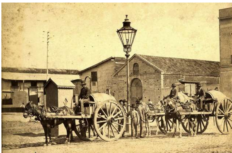
Fig. 2. Aguateros en Buenos Aires. 1890. Tomado de Domínguez, 2016:32.

siglo XIX, un porcentaje significativo de las viviendas porteñas ya contaba con pozos y con su correspondiente brocal por encima. La napa hasta la cual se excavaba, inicialmente, se encontraba en promedio entre 7 y 10 metros de profundidad, por debajo del nivel de superficie, y el agua extraída era potable pero ligeramente salobre. Sin embargo, el incremento de la población en el casco urbano y la progresiva multiplicación de los pozos de basura y pozos ciegos en las viviendas (frecuentemente