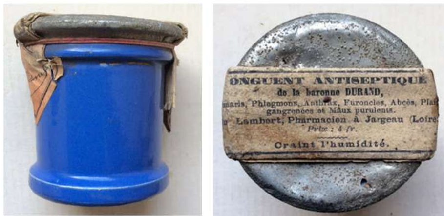
Fig. 12. Lateral y vista superior de una ollita o pote de ungüento antiséptico de colección, sin abrir, con su tapa metálica original, tal y como debieron tenerlas las piezas halladas en el sitio.

particular combinación de factores que influyeron en su conservación durante más de dos siglos y que hicieron posible su recuperación a gran escala generó un registro que permite ahondar en aspectos particulares de la vida cotidiana de la ciudad en el siglo XIX.